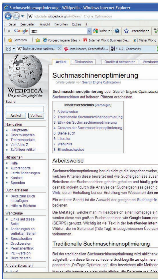
Gut strukturierter Text kommt besser an