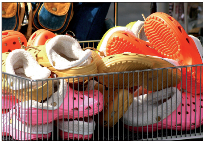
Imageschädigend sei die Produktpräsentation im Netz, so die Hersteller

Das der Vertriebskanal Internet gerade Herstellern hochpreisiger Produkte ein Dorn im Auge ist, bekommen Webhändler seit Jahren zu spüren. Eine aktuelle eBay-Studie hat zu dem Konflikt jetzt Zahlen geliefert: Von 347 befragten deutschen Onlinehändlern berichtet jeder Zweite von der innerhalb der EU verbotenen Preisbindung der zweiten Hand: Die Hersteller hätten gefordert, dass ein Produkt im Netz nicht unter einem festgelegten Preis verkauft werden darf – hielt sich der Händler nicht daran, wurde er nicht beliefert. Markenartikel müsstest in der Lage sein, bestimmte, den Markenwert schädigende Vertriebsformen auszuschließen, begründet der deutsche Markenverband die harte Linie der Hersteller gegenüber dem Onlinekanal.